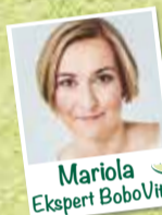
Mariola Ekspert BoboVita

Dla zdrowia dziecka istotna jest urozmaicona i zbilansowana dieta oraz zdrowy tryb życia. Komponując jadłospis kieruj się zasadami żywienia i rekomendacją lekarza. Pamiętaj o higienie zębów swego dziecka.